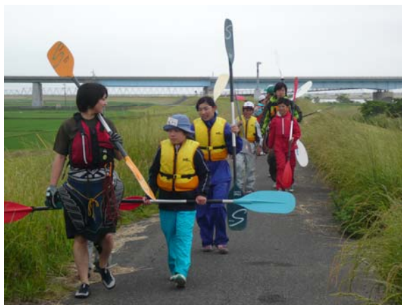
利根川大橋から一之分目揚排水機場下流へ移動