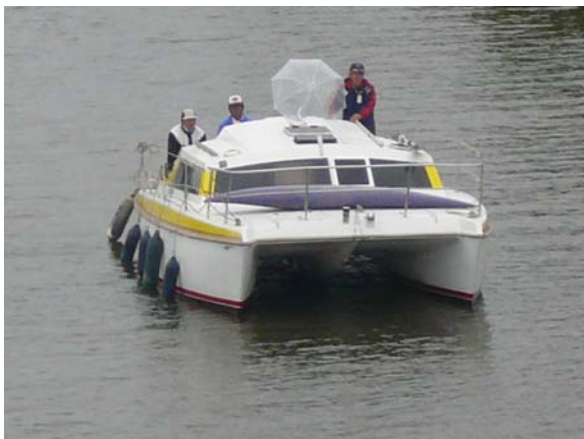
伴走艇(カタマラン、元歯科医所有)