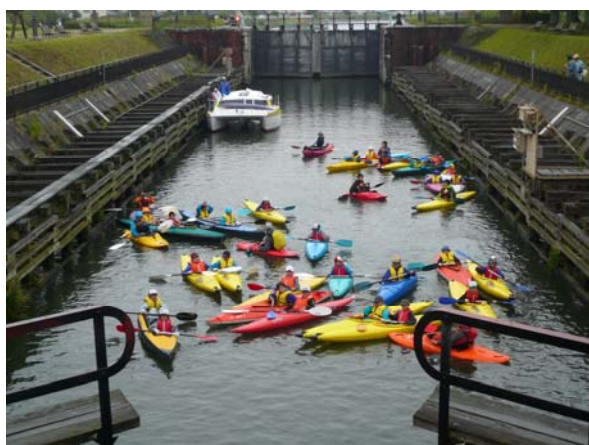
横利根閘門内の状況