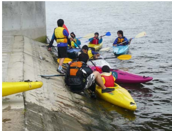
利根川大橋(東関道)で休憩のため上陸