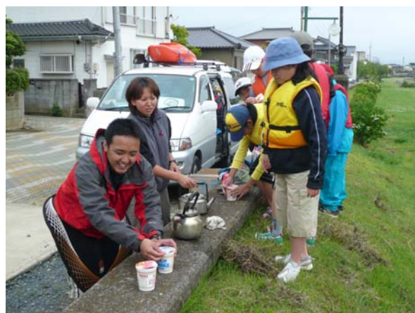
牛堀での昼食(カップヌードル、ソーセージ、チョコレート)