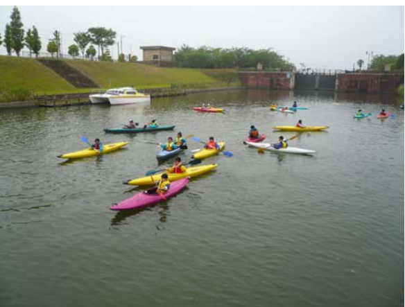
利根川へ向けて出航