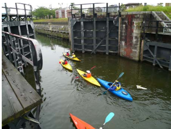
横利根閘門への進入