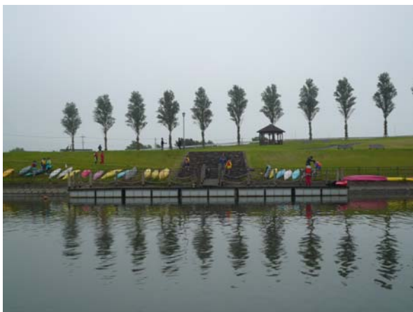
陸揚げされたカヌー