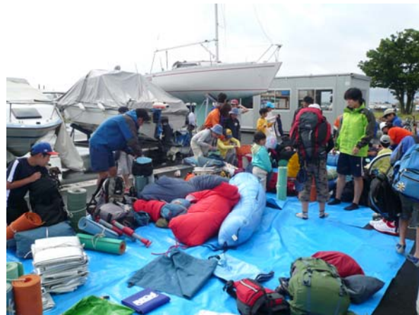
出発前の準備(ラクスマリーナ内)