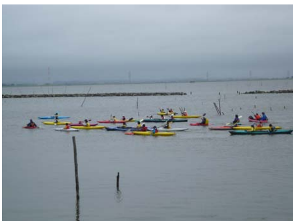
消波堤と湖岸堤間を航行