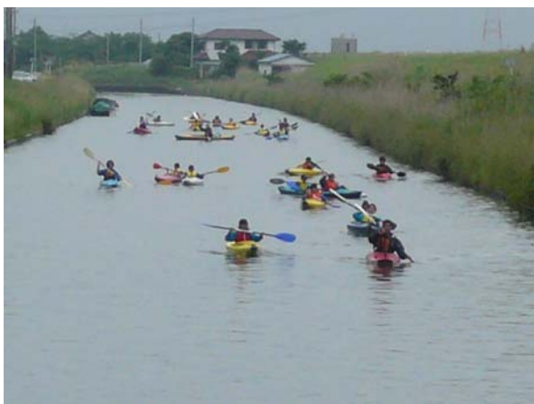
小堀川を航行するカヌー