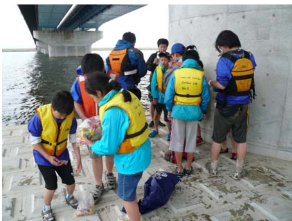
風をよけて休憩(トイレとおやつ)