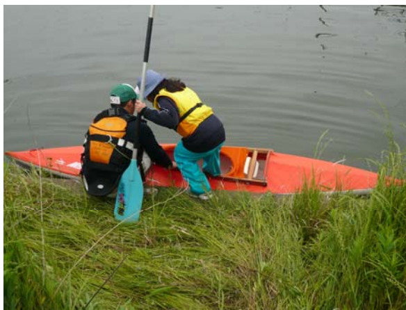
小堀川で乗り換え