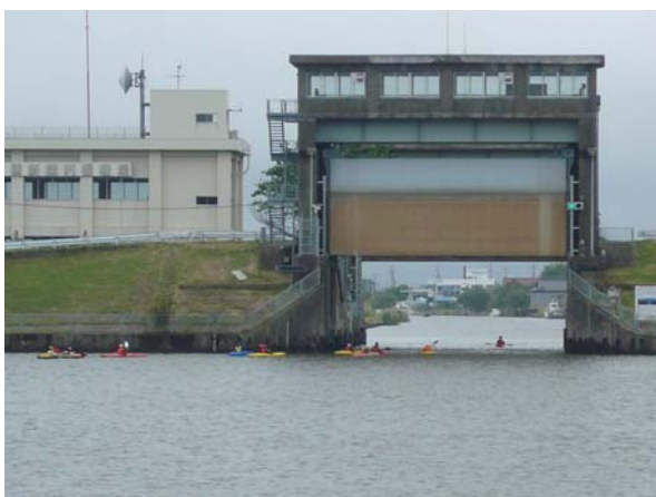
新横利根閘門から横利根川へ