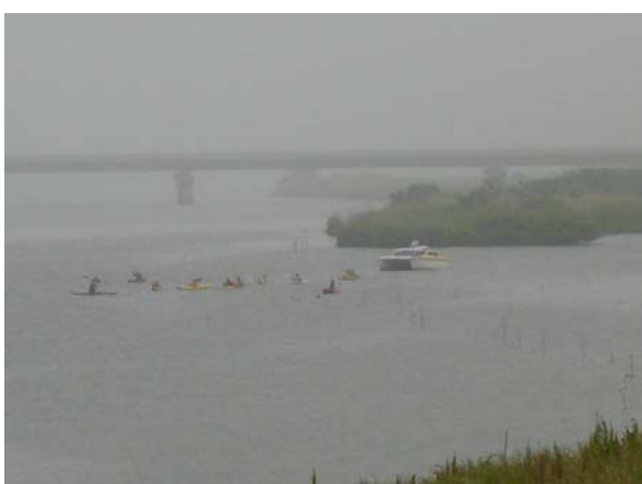
利根川へ漕ぎ出す(早朝なのでやっている)