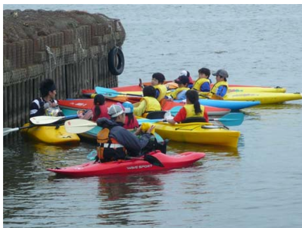
漁港の突堤で風をよけて休息(飴の配布)