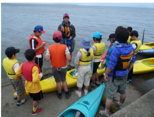
出航前の班別打合せ