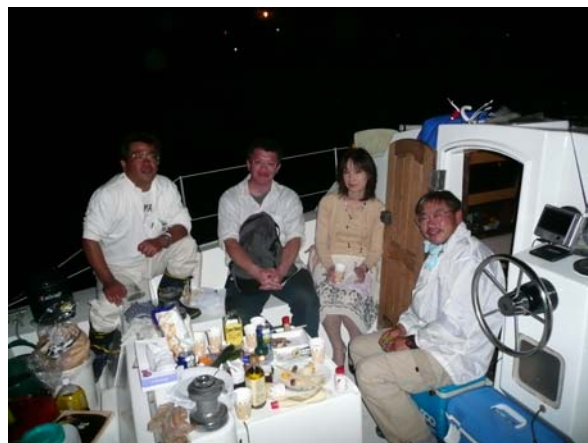
夜の懇親会に顔を出してみました