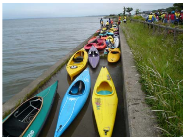
用意されたカヌー