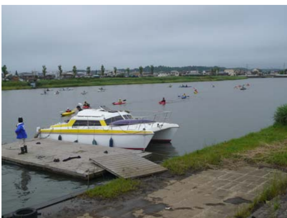
ゴールの黒部川B&G海洋センターに到着