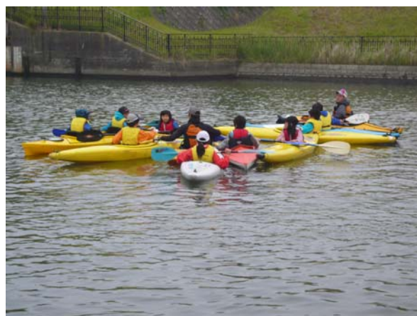
利根川出航前に班別に水上で打合せ