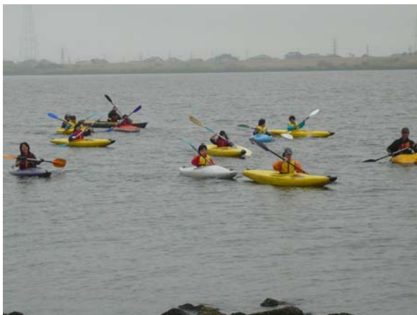
利根川右岸を航行する最後尾班