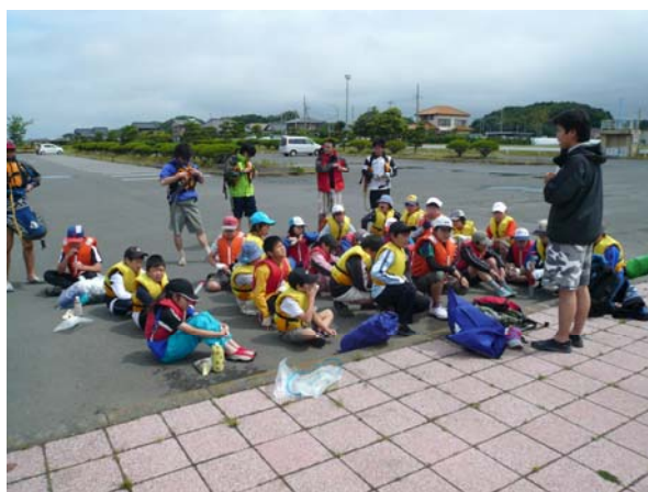
天王崎公園での出航前挨拶