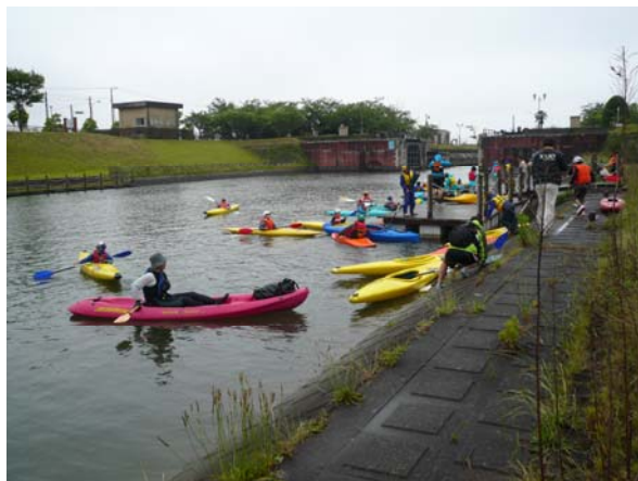
横利根閘門前の浮棧橋から上陸