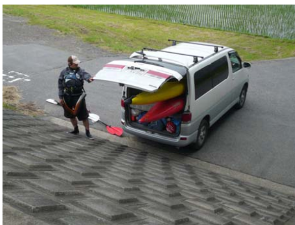
南風で思うように進めず、小堀川へカヌーを移動