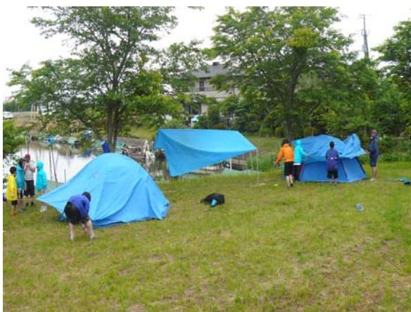
テント、タープの設営