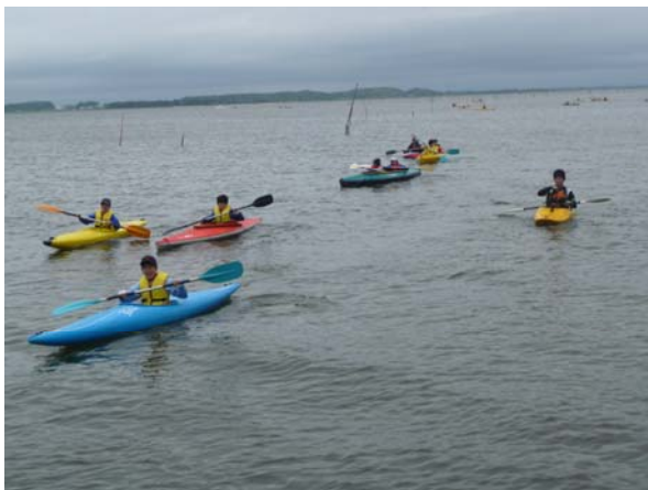
霞ヶ浦を班別で航行