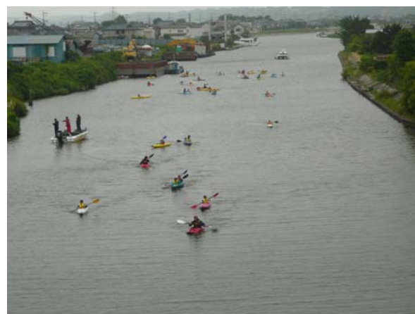
横利根川を航行するカヌー